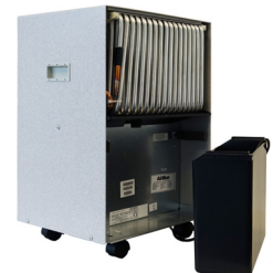
Gerät seitlich mit Behälter